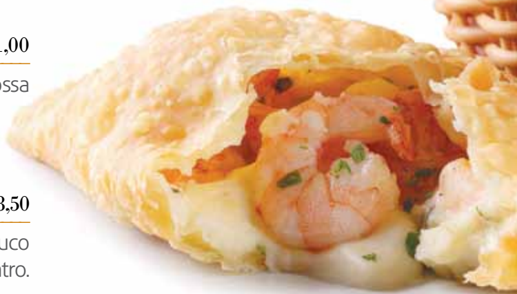
Pastel de Camarão

Carne de sol desfiada e refogada na manteiga do sertão com cebola roxa, nata fresca e coentro. Coberta com purê de macaxeira e gratinada com queijo de coalho.