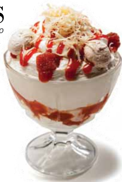
Taça Romeu e Julieta