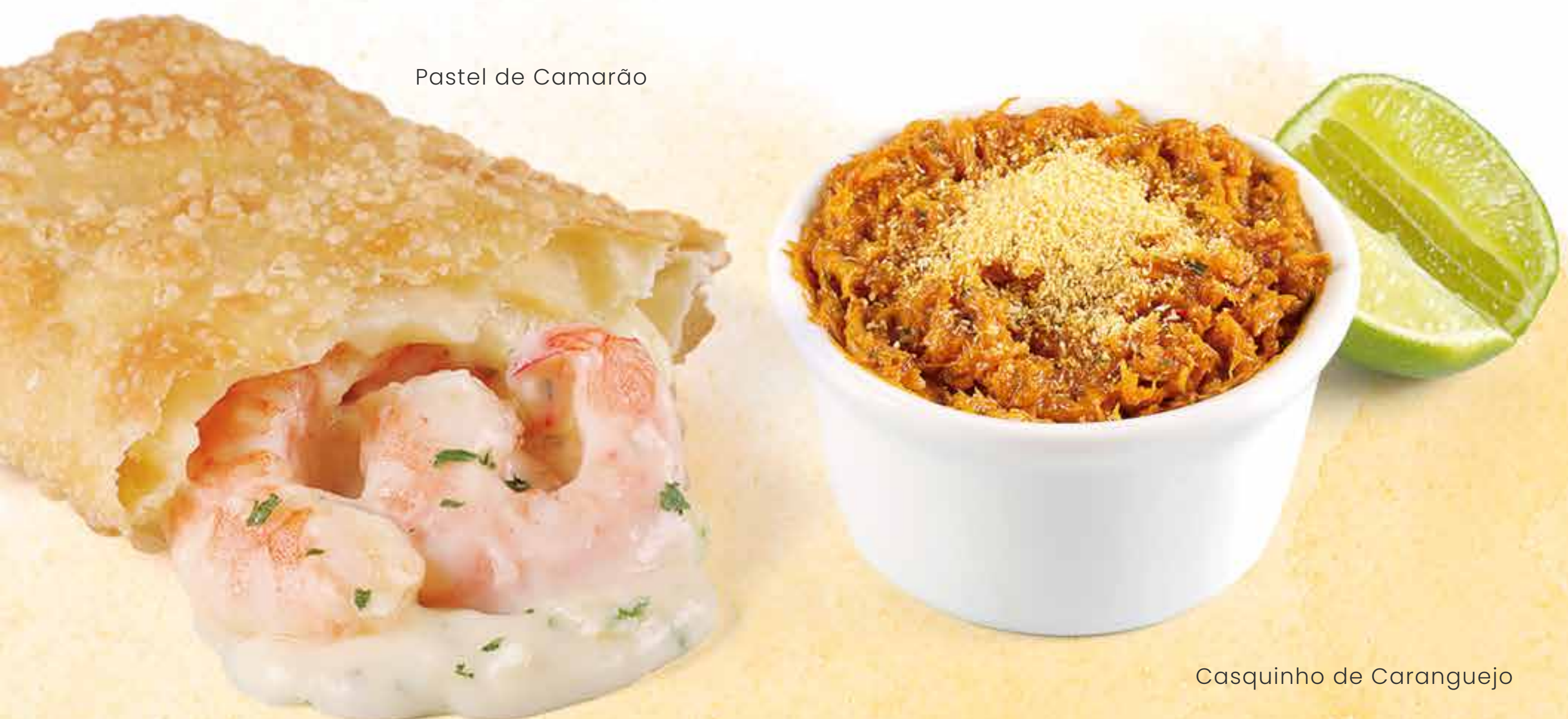
Pastel de Camarão