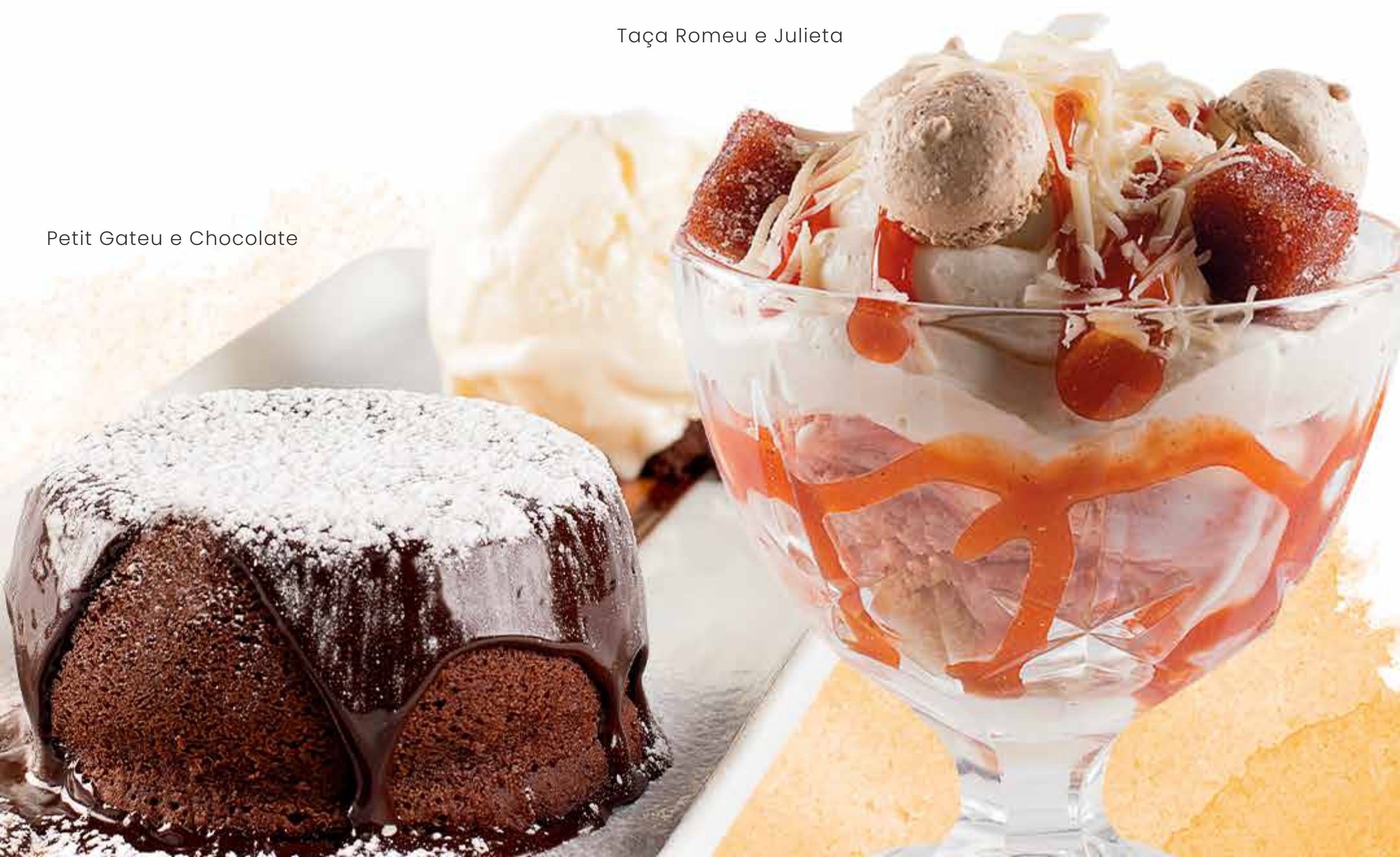
Petit Gateu e Chocolate