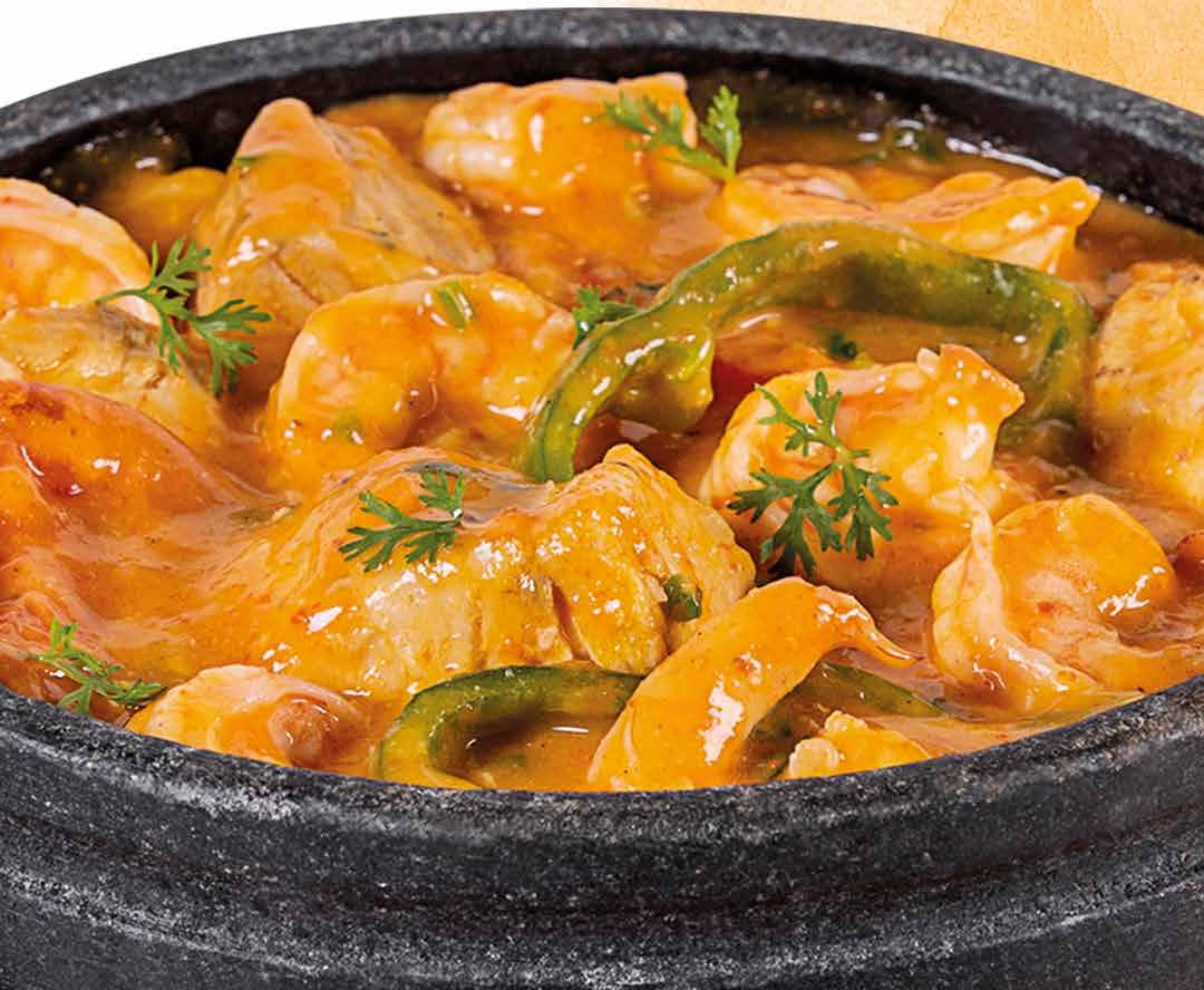
Moqueca de Peixe e Camarão