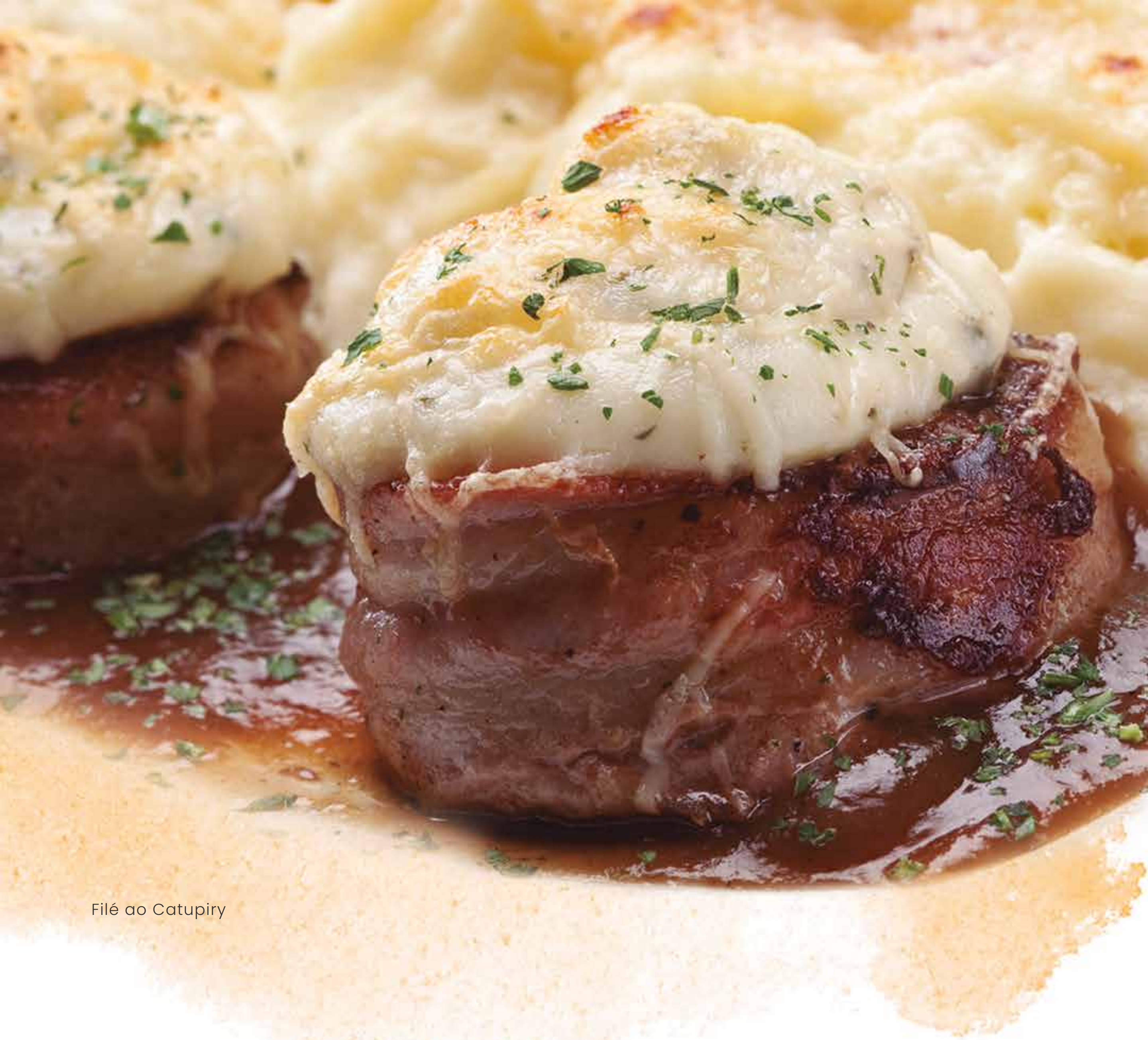
Filé ao Catupiry